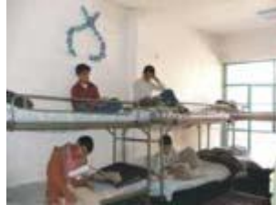
و یا سر بازی

بچه ها همانطور که دقت کردید ممکن است انسان خانواده خود را به علت جنگ ، زلزله ، سیل ، آتش سوزی ، تصادف و بیماری از دست بدهد . از سوی دیگر ما با وجود علاقمندی و وابستگی شدید به اعضای خانواده خود ، همیشه در کنار آن ها نخواهیم بود و به دلایلی مانند ادامه تحصیل