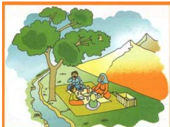
شکل ۲- منظره‌ای از گذران اوقات فراغت در هوای آفتابی و صاف