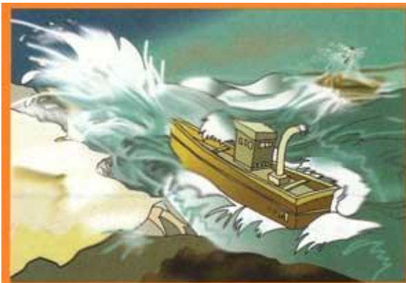
شکل ۱- منظره‌ای از طوفان دریا و کنشی طوفان زده

دانش آموز گرامی همانطور که می دانید هوا در زندگی ما نقش بسیار مهمی دارد برای انجام بسیاری از کارهای خود بایستی از وضعیت آب و هوا مطلع باشیم . به تصاویر زیر دقت کنید ، رفتار ما در هر نوع هوا به شکل خاصی است .