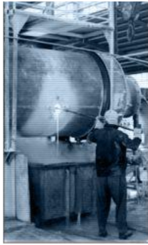
کار در کارخانه ها