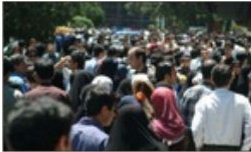
جمعیت در شهرها

همچنین روستا ها از شهرها کم جمعیت تر هستند .