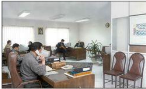
کار در اداره ها

همچنین روستا ها از شهرها کم جمعیت تر هستند .