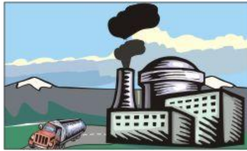
مشغول شده اند.