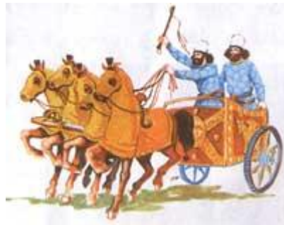
ارابه جنگی مربوط به گارد جاویدان از سپاه سواره داریوش اول هخامنشی که با این ارابه ها تا یونان پیش رفت.

آدرس لینک صفحه : www.amouzeshelmi.ir/tarikh/1/01/tarikh-1-1.htm