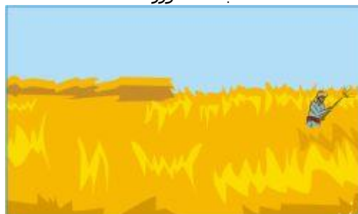
و بعدها به صنعت