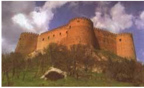
قلعه فلک افلاک از دوره ساسانی احتمالاً مربوط به دوره بهرام ساسانی