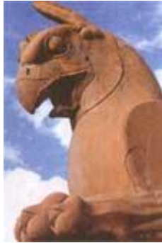
یکی از سر ستونهای تخت جمشید کاخ صد ستون یک کاخ آپادانا «نشانه هما - پرنده سعادت است - نشانه های هواپیمای ایران»