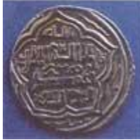
سکه های دوران اسلامی با نوشته ی لا اله الا الله محمد رسول الله