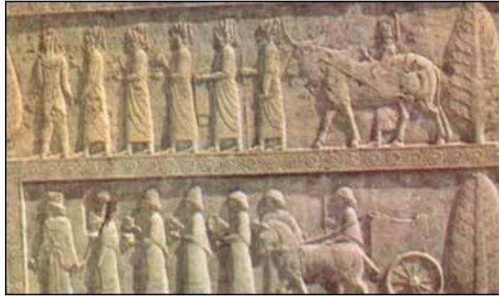
نقش نمایندگان ملل تابعه با هدایایی در تخت جمشید

پایتخت زمستانی آنها شهر شوش بود و معروفترین پایتخت آنها تخت جمشید پایتخت بهاری بود که جشن عید نوروز با شکوه خاصی برگزار می گردید و اقوام مختلف با هدایای خود در این جشن شرکت می کردند.