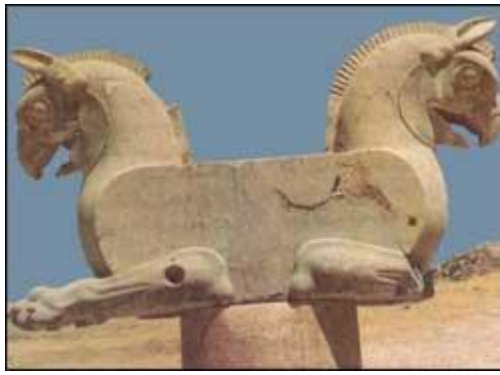
نمونه ای از سرستون های تخت جمشید