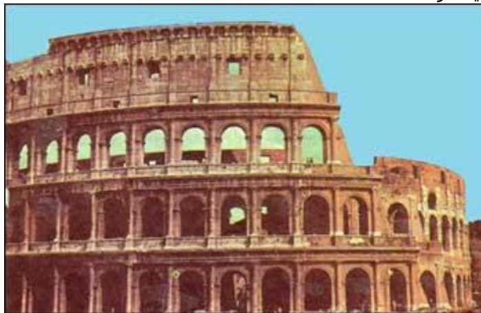
کولر سه ام میدان ورزشی رم باستان

کوشانی ها در شرق ایران بودایی بودند در غرب ایران دولت دوم در کشور ایتالیای کنونی به پایتختی شهر روم تأسیس شد و کم کم سرزمین های اطراف دریای مدیترانه ، سوریه ، فلسطین و ترکیه ی امروزی را به تصرف خود در آوردند و با اشکانیان همسایه شد - رومی ها به پادشاه خود امپراتوری می گفتند در چنین شرایطی حضرت عیسی (ع) در فلسطین ظهور کرد و مردم ستمدیده که زیر ظلم رومیان بودند به او ایمان آوردند . حضرت عیسی با سفر به شهرها و روستاها مردم را به یکتا پرستی و کارهای نیک دعوت می کرد . دوازده نفر از یاران او که در کارها یاریش می کردند به حواریون مشهور شدند . حواریون سخنان او را گرد آوری کرده و انجیل نامیدند و با گذشت زمان پیروان آن حضرت که مسیحی نامیده می شدند افزوده شد تا جایی که خود امپراتور و بزرگان نیز به مسیحیت گرایش پیدا کردند .