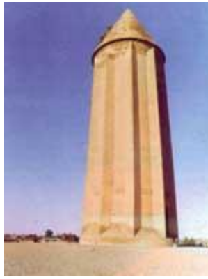
مقبره قابوس بن وشمگیر نوه ی مرداویج یکی از فرمانروایان آل زیاد در شهر گنبد کاووس