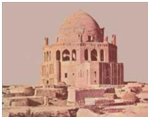
مقبره الجایتو یکی از ایلخانان مغول در سلطانیه، نزدیک زنجان