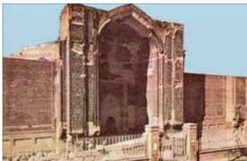
مسجد کبود در تبریز از آثار جهانشاه بن قرايوسف قراقویونلو