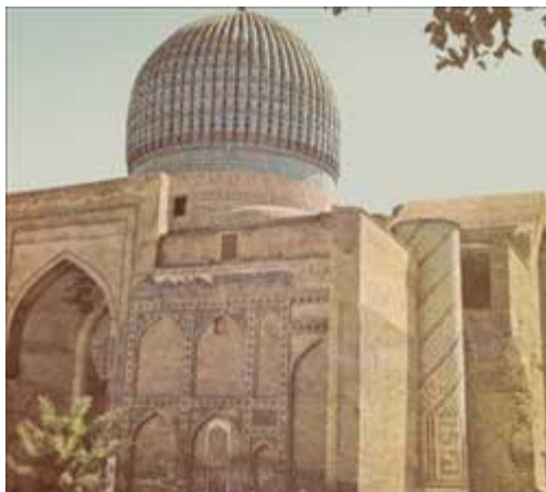
مقبره امیر تیمور گورکانی در سمرقند معروف به گور امیر