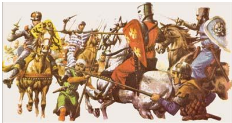
شوالیه ها بیشتر اوقات خود را در جنگ می گذراندند

هنگامی که طارق به سال ۹۲ ه.ق برابر با ۶۷۱ میلادی بخش اعظم اسپانیا را تسخیر کرد مسلمانان تا قلب فرانسه پیش رفتند. در سال ۱۱۴ ه.ق، ۷۳۲ میلادی یکی از سرداران اروپایی جلوی پیشروی مسلمانان در فرانسه را گرفت. در دوره عباسیان کشور بزرگی در اروپا تأسیس شد که به امپراتوری فرانک مشهور بود. پادشاه فرانکها شارلمان نام داشت و همزمان با هارون الرشید زندگی می کرد شارلمان قسمتهای از اسپانیا را از دست مسلمانان گرفت اگر چه شارلمان پادشاه قدرتمندی بود اما از پاپ اطاعت می کرد. در دوره ی سلجوقیان و فتح ملازگرد، پاپ فتوا داد که باید بیت المقدس را که محل زندگی حضرت عیسی (ع) بوده است از دست مسلمانان گرفت و شوالیه ها که بیکار بودند با استقبال از این پیشنهاد به سوی شرق حرکت کردند. آنان پس از فتح بیت المقدس تعداد زیادی از مسلمانان را کشتند.