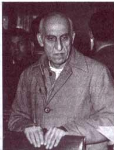
دکتر محمد مصدق

گسترش فعالیت های سیاسی پس از شهریور ۱۳۲۰ شمسی که مصادف با سقوط رضاشاه بود منجر به آگاه شدن مردم در نهایت سبب گسترش مبارزه و ملی شدن صنعت نفت ایران شد و با انتخاب دکتر مصدق به نخست وزیری استعمارگران انگلیسی و آمریکایی زیان هایی زیادی دیده بودند، شروع به کار شکنی های زیادی کردند. از جمله آنها جلوگیری از فروش نفت ایران بود و کشورهای اروپایی از خرید نفت ایران امتناع می کردند. دولت مصدق با مشکلات شدید مالی مواجه بود شوروی ها نیز از خرید نفت و حتی دادن بدهی های قبلی خود به ایران خودداری کردند و مزدوران شوروی ها در ایران که اعضای حزب توده بودند، در کار دولت مصدق کارشکنی می کردند، ولی دولت مصدق به دلیل حمایت مردم و آیت الله کاشانی استوار ماند. ولی دربار و شخص شاه دست به توطئه زدند و اوضاع کشور متشنج شد. مصدق از شاه خواست وزارت جنگ را به او بسپارد اما شاه موافقت نکرد و مصدق استعفا داد. شاه بلافاصله قوام السلطنه را به نخست وزیری منصوب کرد. با انتشار خبر نخست وزیری قوام آیت الله کاشانی طی اعلامیه ای گفت اگر قوام ظرف چهل و هشت ساعت کنار نرود اعلام جهاد خواهد کرد و خود پس از پوشیدن کفن پیشاپیش مردم به میدان خواهد آمد. در نتیجه در روز سه، ام تر ماه سال ۱۳۳۱ مردم به خیابان ها ریختند و در مقابل گله