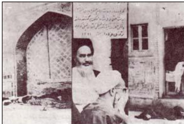
صحنه ای از جنایات شاه در فیضیه

با تحریم همه پرسبی توسط امام خمینی (ره) شاه تصمیم گرفت به قم مسافرت کند و با بهره برداری از استقبالی که تصور می کرد از وی به عمل خواهد آمد، توجه مردم را به خود جلب کند. اما امام خمینی اعلامیه ای دادند و مردم را به ماندن در خانه ها فرا خواندند و استقبالی از شاه نشد و در ۶ بهمن ۱۳۴۱ این همه پرسبی انجام شد و رژیم شاه اعلام کرد که اکثریت رأی دهندگان با این اصول موافق هستند، لذا امام خمینی به منظور متوجه ساختن مردم به عواقب همه پرسبی در ماه رمضان آن سال نماز جماعت و تبلیغ را در سراسر کشور تعطیل کردند و این حرکت رژیم را به وحشت انداخت و شاه دنبال فرصتی می گشت تا تهاجمی علیه روحانیون آغاز کند. صبح روز دوم فروردین ۱۳۴۲ که مردم به مناسبت سالگرد شهادت امام صادق (ع) در منزل امام خمینی در قم گرد آمده بودند، مأموران حکومتی می خواستند مجلس را به هم بزنند ولی موفق نشدند ولی در عوض بعد از ظهر آن روز بدعوت آیت الله گلپایگانی مجلس سوگواری امام صادق در مدرسه فیضیه منعقد شده بود. مأموران وارد مدرسه شدند و کشتار وحشیانه ای را به راه انداختند. پس از کشتار فیضیه امام خمینی سکوت در برابر رژیم را حرام دانستند و اظهار حقایق را واجب دانستند و خود امام در این سه مسئله، دولت اسدالله علم را باز خواست (استیضاح) نمودند.