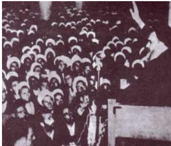
سخنرانی امام خمینی در میان مردم قم در مدرسه ی فیضیه عاشورای ۱۳۴۲

روز عاشورا مردم تهران به طرف دانشگاه حرکت کردند و تا مقابل کاخ مرمر پیش رفتند و شعار مرگ بر دیکتاتور دادند و در شهر قم، مردم شهرهای مختلف برای زیارت و شنیدن سخنان امام خمینی در مدرسه فیضیه و صحن های حضرت معصومه (س) اجتماع کردند و با وجود مخالفت های رژیم امام خمینی با قاطعیت تمام از میان انبوه جمعیت عبور کردند و در یک سخنرانی تاریخی علیه اقدامات شاه و وابستگی آن به بیگانگان سخن گفتند.