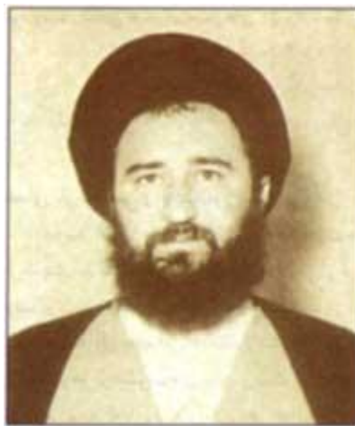
شهید حاج آقا مصطفی خمینی

بله توهین به امام در روزنامه اطلاعات بیشترین واکنش در میان طلاب قم را داشت. طلاب درسهای خود را تعطیل کردند و روانه منزل مراجع قم شدند. عصر روز نوزدهم دی ماه ۱۳۵۶ مأموران دولتی به روی تظاهر کنندگان آتش گشودند و جمع زیادی را شهید کردند. این اقدام عکس العمل شدیدی را در سطح کشور در برداشت و چهل روز بعد، مردم تبریز در چهلمین روز شهدای قم به تظاهرات پرداختند که مأموران شاه برخورد خونینی با آنها داشتند. قیام قم و تبریز به زودی به بسیاری از شهرهای ایران از جمله یزد، جهرم و کازرون کشیده شد و با آمدن سال ۱۳۵۷ مردم مصمم تر در سرنگونی رژیم شدند و سال ۵۷ را می توان سال انفجار خشم فرو خورده مردم ایران دانست. لذا شاه، جمشید آموزگار را بر کنار و مهندس شریف امامی را جایگزین او کرد تا با فریب مردم از گسترش انقلاب جلوگیری کند. ماه رمضان سال ۵۷ ماه اوج گیری بیشتر انقلاب بود. نماز عید فطر سال ۵۷ به امامت دکتر محمد مفتاح و سخنرانی دکتر محمد جواد باهنر برگزار شد که به تظاهرات میلیونی تبدیل شد. در بامداد روز جمعه ۱۷ شهریور رادیوی ایران حکومت نظامی در تهران و ۱۱ شهر را قرائت کرد. ولی مردم تهران تصمیم گرفتند در روز ۱۷ شهریور در میدان ژاله اجتماع کنند و بدون توجه به تهدیدات نظامیان اجتماع کنند. ولی مأموران شاه آنان را به گلوله بستند و هزاران زن و مرد و کودک و جوانان را به شهادت رساندند. از آن پس، ۱۷ شهریور به جمعه سیاه معروف شد. شاه از