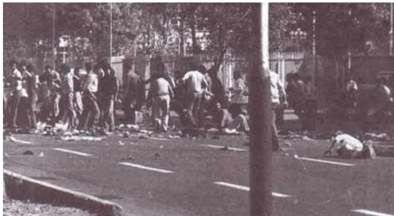
جمعه سیاه، درگیری خیابانی و تظاهرات مردم در میدان ژاله ۱۷ شهریور ۱۳۵۷ تهران