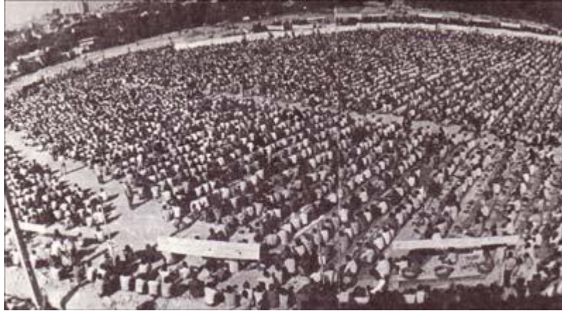
نماز عید فطر ماه رمضان سال ۵۷ در قیطره تهران

طریق حکومت عراق، امام را وادار به ترک نجف کرد امام نیز از عراق به کویت رفتند ولی دولت کویت مانع ورود امام به این کشور شد و امام به ناچار عازم فرانسه شدند و در (نوفل لوشاتو) یکی از دهکده های نزدیک پاریس اقامت گزیدند.