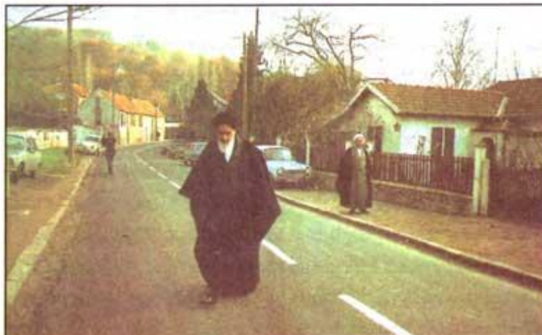
امام خمینی (ره) در زمان تبعید در فرانسه، نوفل لوشاتو، حومه ی پاریس

در روز ۱۵ بهمن امام، مهندس مهدی بازرگان را به ریاست دولت موقت تعیین کردند چند روز بعد همافران نیروی هوایی به انقلاب پیوستند و مأموران گارد شاهنشاهی با حمله به پادگان آنها قصد درگیری داشتند. همافران با مسلح شدن خود و مسلح کردن مردم به مبارزه پرداختند. دولت بختیار حکومت نظامی را از ساعت ۹ شب به ساعت ۴ بعد از ظهر افزایش داد. امام خمینی دستور دادند که حکومت نظامی را نادیده بگیرند و به خیابان ها بریزند و توطئه ی کودتا نیز شکست خورد و در روز ۲۲ بهمن سال ۱۳۵۷ آفتاب بر سر مردم نور پیروزی را به ارمغان آورد و انقلاب پیروز شد.