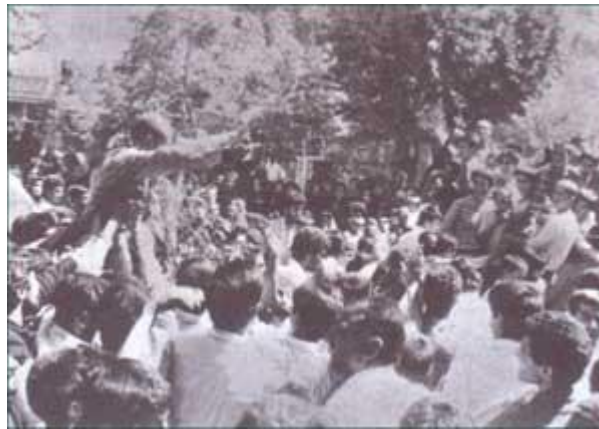
استقبال مردم از آزادگانی که پیروزمندانه به میهن بازگشتند

و هدایت کشتی انقلاب در طوفان پر تلاطم به دست توانای ایشان همچنان استوار به پیش می تازد و تا رسیدن به هدف نهایی انقلاب که ایجاد یک کشور اسلامی است ادامه می یابد.