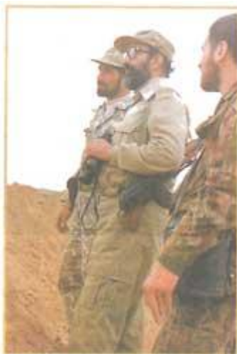
شهید دکتر مصطفی چمران و دو تن از هم‌زمانانش

فردای بیست و دوم بهمن کمیته انقلاب اسلامی بوجود آمد تا هم نظم و امنیت را در کشور برقرار سازد و هم سران جنایتکاران حکومت شاه را دستگیر کند. و نهادهایی مانند سپاه پاسداران انقلاب اسلامی برای دفاع از انقلاب و جهاد سازندگی برای سازندگی کشور و خدمت به کشاورزان و روستاییان محروم بوجود آمد. در سال ۵۸ نماز جمعه در تهران و بعداً در شهرهای دیگر برپا شد و اولین خطیب نماز جمعه مرحوم آیت الله طالقانی ابودر زمان و یار وفادار امام خمینی بودند که خیلی زود در شهریور ۵۸ از میان همگان رفتند. قدرت یافتن و انسجام حکومت دینی و پس لرزه های انقلاب که باعث بیداری کشورهای اسلامی منطقه و جهان سوم را باعث شده بودند دشمنان انقلاب را هراسان ساخت و آنها با ایجاد مشکلات و توطئه های مختلف درصدد براندازی انقلاب برآمدند. در آغا؛ مذهبان سگانه که مردم آنها را گوهک می نامدند در بعضی از مناطقی، کشته نامنی، ایجاد