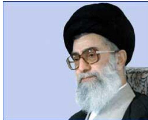
آیت الله خامنه ای رهبر معظم انقلاب اسلامی

آدرس لینک صفحه : www.amouzeshelmi.ir/tarikh/3/16/tarikh-3-16.htm