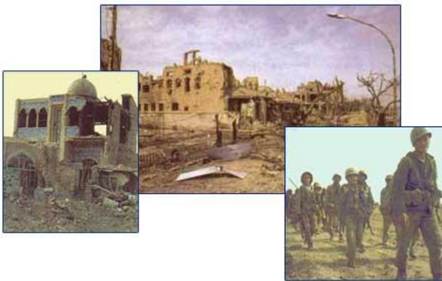
گوشه ای از ویرانی های جنگ و مبارزات رزمندگان اسلام در برابر دشمن متجاوز بعثی